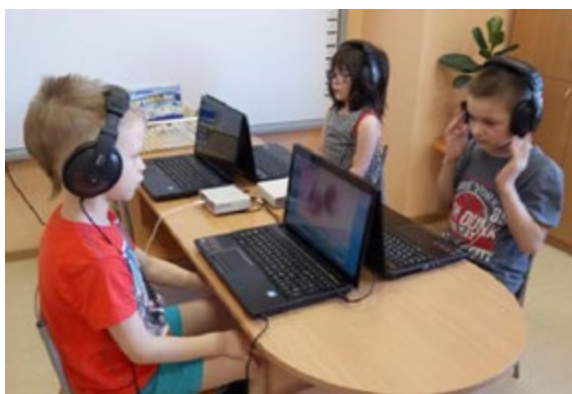
Рис. «Занятия в кабинете БОС»