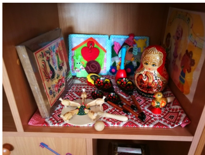
Уголок сенсорного развития