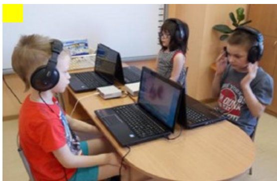
Рис. «Занятия в кабинете БОС»